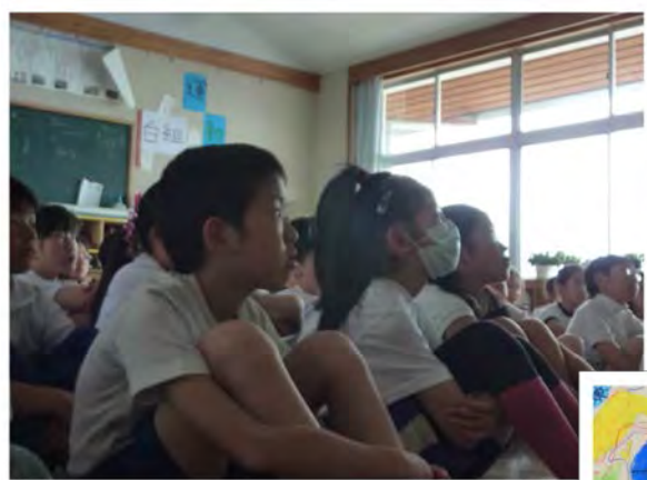
↑温暖化のシミュレーション画像を食い入るように見つめる子どもたち ぼくたちの未来はどうなるの？