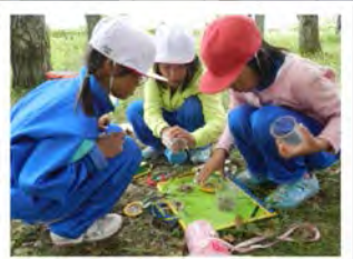
宝物になりそうな物は？