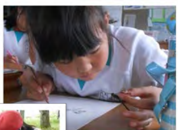
↑つかまえたトンボをスケッチ