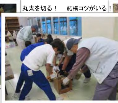
丸太を切る！ 結構コツがいる！