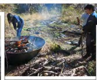
←無煙炭化器による炭焼き