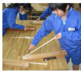
初めてのナイフ体験 慎重に・・・