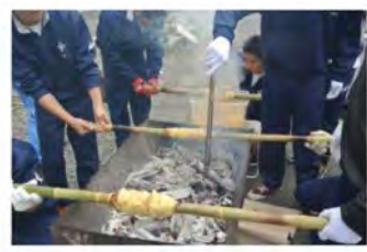
↓作った炭でバームクーヘンを焼く