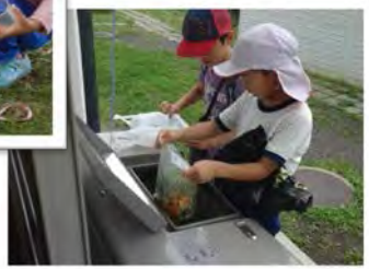
堆肥化装置に生ごみ投入開始！