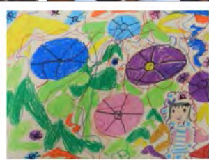
地球を守る、→ カーテンを育てる