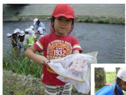
↑見て 見て とったよ