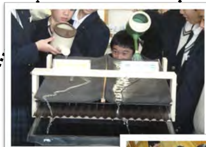
↑森林と荒地では雨水の染み込み方がどう違うか、実験しながら考える。