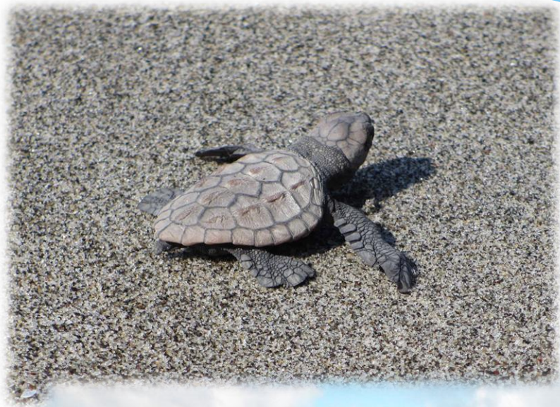
← アカウミガメ(子ガメ)